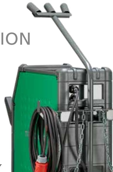
Crochet permettant d'enrouler facilement les câbles longs.

Support de torche. Équipement standard (photo). Un support disponible en option peut être installé sur le côté gauche du poste à souder (référence 78861557).