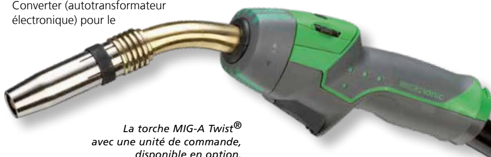
La torche MIG-A Twist® avec une unité de commande, disponible en option.

Plusieurs longueurs de torche et modèles de col de cygne sont disponibles au choix. La torche peut être équipée de différentes unités de commande pour le réglage du courant de soudage à la poignée de la torche. L'unité de commande peut être échangée facilement en fonction des besoins, et ce sans le moindre outil.