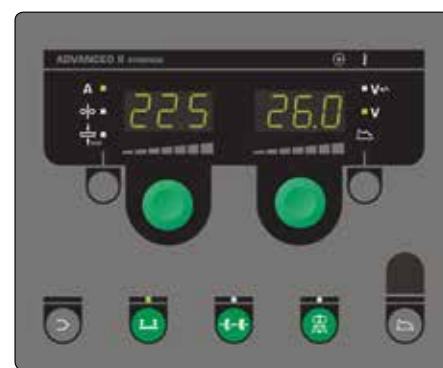
Advanced : intègre notamment les programmes PowerArc™ et DUO Plus™, pour un très bel aspect de cordon (aspect TIG) et un meilleur contrôle du bain de soudure. Ce panneau de commande inclut des programmes spécifiques au soudage et au brasage MIG avec fils fourrés ou massifs sur acier doux, acier inoxydable et aluminium.