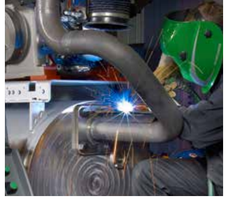
Soudage sur acier doux.