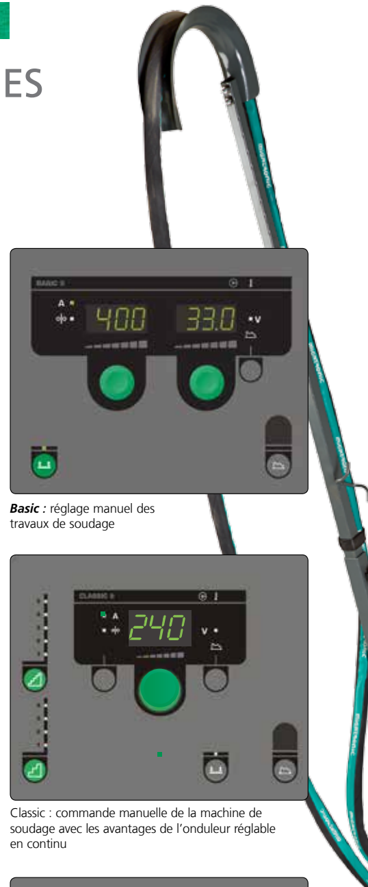
Basic : réglage manuel des travaux de soudage

PowerArc™ assure une parfaite pénétration des soudures d'angle et des soudures bord à bord sur acier doux et acier inoxydable.