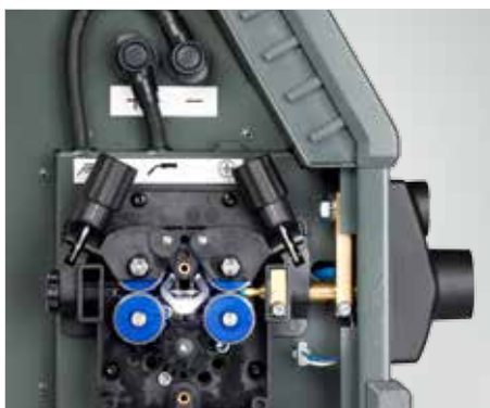
Éclairage LED intégré à la console de dévidage (référence 78861545)