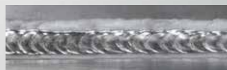
DUO Plus™ - Aluminium

Cette fonction optimise le contrôle du bain de soudure et réduit l'apport de chaleur.